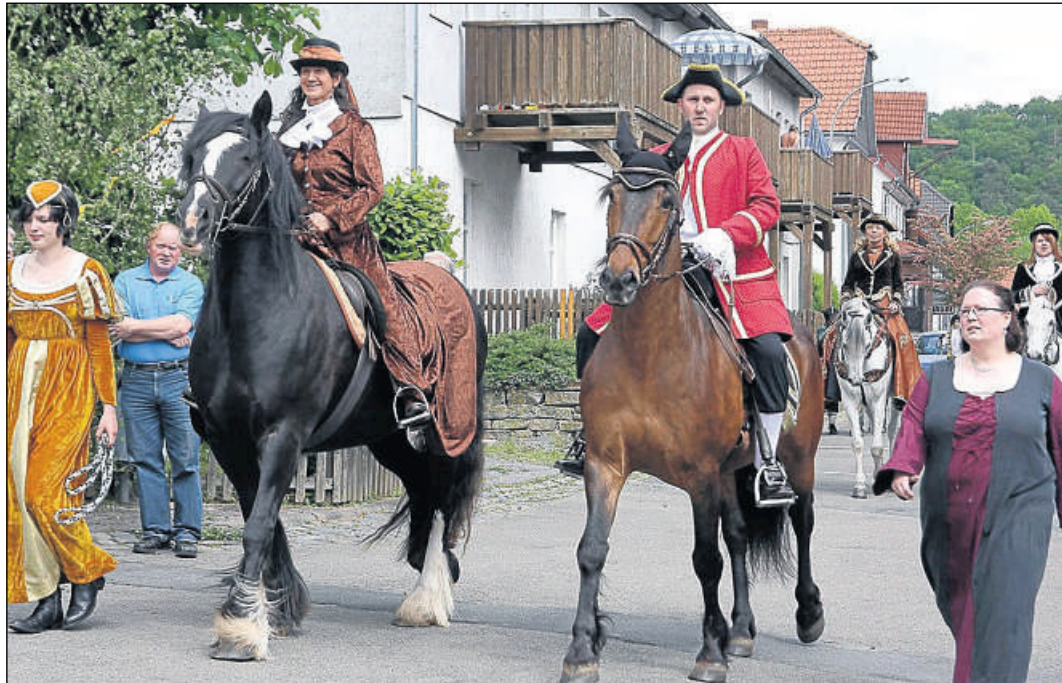
Hoch zu Ross: Die Mitglieder des Reit- und Fahrvereins präsentierten sich beim Festzug zum Sachsenberger Pfingstmarkt in historischen Kostümen.

Beim Einmarsch bildeten Pfeifer und Trommler des Spielmannszuges einen harmonischen Kontrast zu den Bläsern des Musikzuges. Für Gänsehautstimmung sorgte die Serenade der Bottendorfer. Bei Czapaniskis Aufforderung „Helm ab zum Gebet“ entledigten sich die Feuerwehrleu-