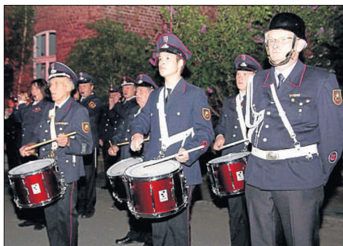
Zapfenstreich: Der Spielmannszug Sachsenberg erfreute die Besucher mit Märschen