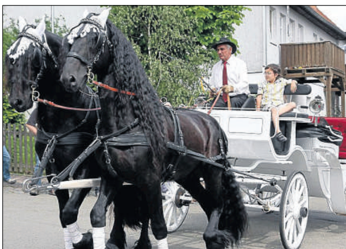
Von prächtigen Friesen-Hengsten gezogen: die weiße Hochzeitskutsche beim Umzug.

Anzeigenpreisliste Nr. 53. Monatlicher Abonnementspreis einschließlich Verlagszustellung Euro 26,20 (bei Postzustellung Euro 28,40) inkl. 7% MwSt. Beendigung des Abonnements nur mit schriftlicher Kündigungserklärung unter Einhaltung einer Frist von 6 Wochen zum Quartalsende, ab Zugang der Kündigungserklärung. Rechte für elektronische Pressespiegel: PMG Presse-Monitor GmbH, 0 30 / 2 84 93-0 www.presse-monitor.de Herstellung: Zeitungsdruck Dierichs GmbH & Co KG, Wilhelmine-Reichard-Str. 1, 34123 Kassel. Kostenlose Druckhausführungen für Einzelpersonen und Kleingruppen unter 0 56 1 / 2 03 - 40 11