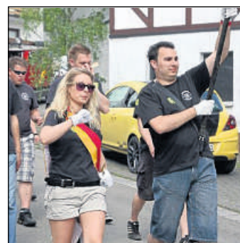
Mit von der Partie: die Mitglieder der Sachsenberger Burschenschaft.