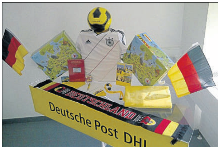
Fan-Ausstattung: In dem Fan-Paket zur Fußball-Europameisterschaft ist vieles drin, was ein echter Fan braucht. Eines von zehn Fan-Paketen können Sie heute gewinnen.